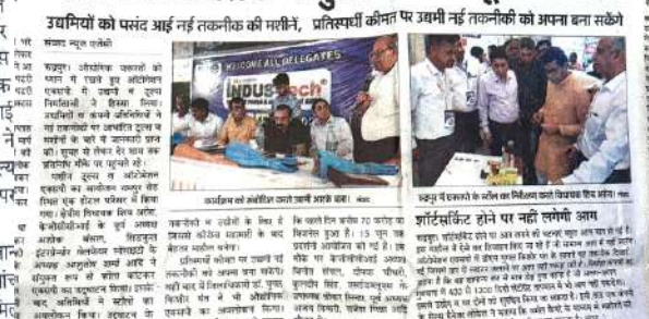
उद्यमियों को पसंद आई नई तकनीकी की गरीबी, प्रतिस्पर्धी कीमत पर उद्यमी नई तकनीकी को अपना बना सकते

उद्यमियों को पसंद आई नई तकनीकी की गरीबी, प्रतिस्पर्धी कीमत पर उद्यमी नई तकनीकी को अपना बना सकते। उद्यमियों को पसंद आई नई तकनीकी की गरीबी, प्रतिस्पर्धी कीमत पर उद्यमी नई तकनीकी को अपना बना सकते। उद्यमियों को पसंद आई नई तकनीकी की गरीबी, प्रतिस्पर्धी कीमत पर उद्यमी नई तकनीकी को अपना बना सकते।